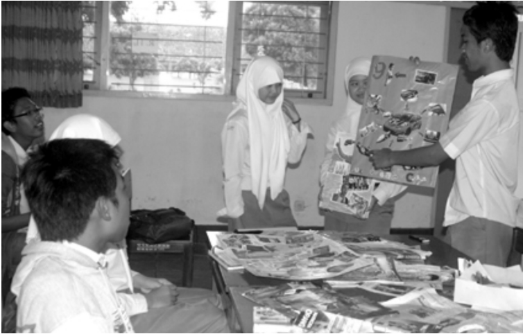
Foto 2. Siswa mempresentasikan karyanya di kelas.

karena pilihan tersebut akan menunjukkan pendapat dan pengalaman peserta.