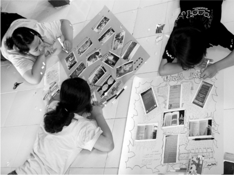
Foto 3. Peserta bekerja menyusun hasil pemotretan dan menuliskan narasi.