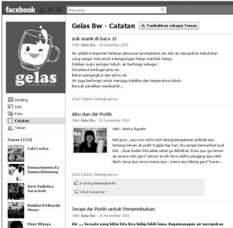
Foto 5. Informasi pentingnya air putih yang diunggah di jejaring sosial.

Secara terfokus peserta diajak untuk membedah persoalan minuman bersuplemen. Untuk itu dihadirkan narasumber dari perusahaan iklan, ahli gizi, dan penggiat lingkungan hidup. Peserta melakukan wawancara terhadap ketiga narasumber untuk memperoleh informasi mengenai bagaimana media membungkus suatu produk melalui iklan, dampak konsumsi minuman bersuplemen terhadap tubuh, serta dampak limbah botol minuman bagi lingkungan. Informasi tersebut selanjutnya dipublikasikan melalui media jejaring sosial facebook dan secara berkala memperbarui informasi yang disampaikan di dalamnya. Lebih jauh, peserta melakukan gerakan membawa botol air minum sendiri ke sekolah. Gerakan tersebut dilakukan dengan cara menyiarkannya melalui facebook serta pembuatan sticker . Bertepatan dengan peristiwa meletusnya gunung Merapi di Yogyakarta pada waktu itu, peserta pelatihan melakukan pengumpulan bantuan berupa air putih untuk disumbangkan ke posko-posko pengungsian.