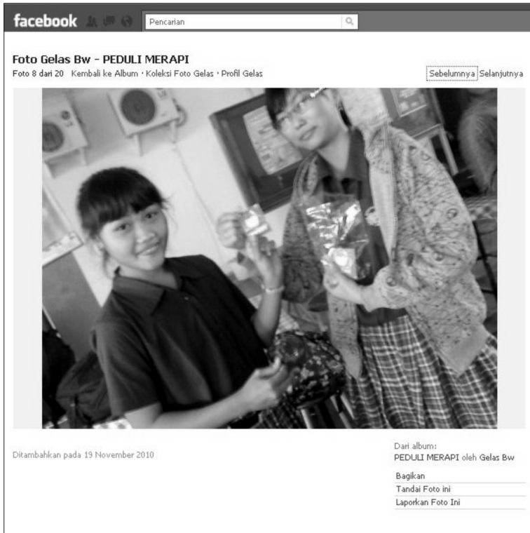
Foto 6. Peserta pelatihan membagikan sticker untuk teman mereka yang ikut menyumbangkan air putih untuk pengungsi Merapi.