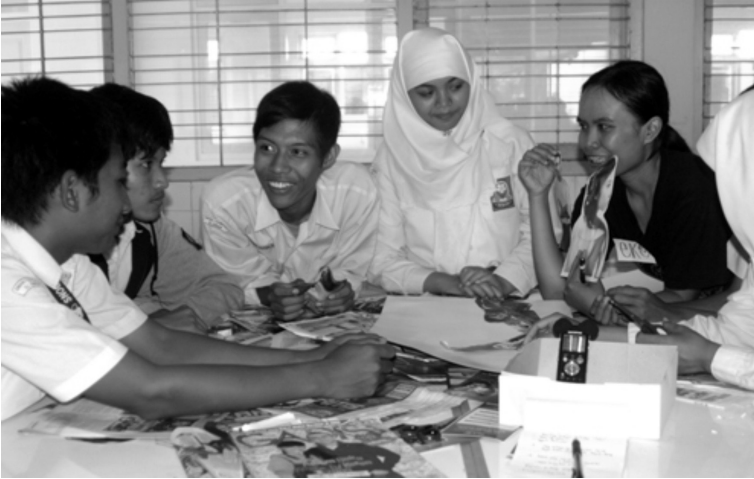
Foto 1. Peserta berdiskusi dengan fasilitator mengenai tema pelatihan.

kelompok, di mana setiap kelompok didampingi oleh seorang fasilitator. Seorang pemandu juga dibutuhkan untuk memimpin jalannya pelatihan secara umum.