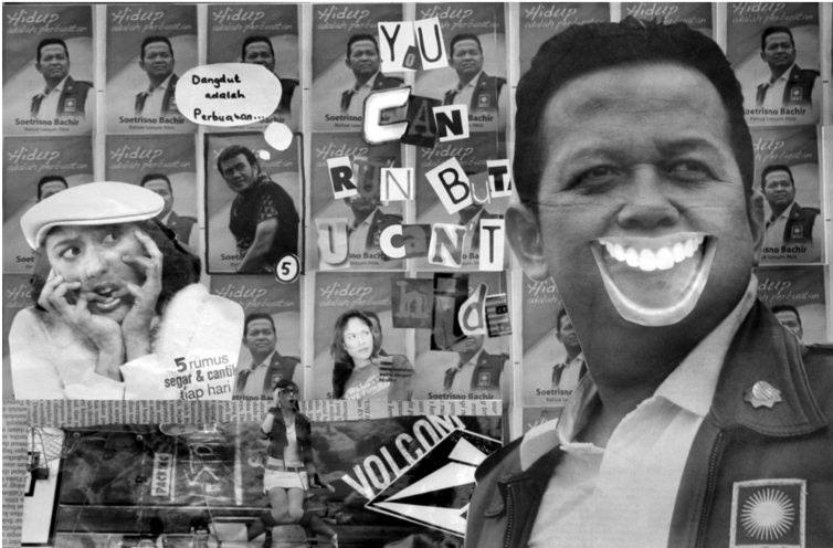
Foto 5. Salah satu hasil pelatihan literasi media dengan metode kolase. Peserta menyoroti mengenai banyaknya iklan (kampanye) politik.

Kolase menggunakan gambar dalam film dokumenter pada tahun 2009, dilakukan pada suatu pelatihan yang diikuti oleh 12 siswa dari beberapa SMA di Yogyakarta. Dalam pelatihan ini peserta diajak untuk menonton film dokumenter dengan tema permasalahan sosial yaitu pendidikan untuk anak jalanan. Diskusi dilangsungkan setelah selesai menonton film tersebut. Berfokus pada pesan dalam film dan mencermati bagaimana alur cerita dan teknik pengambilan gambar dibangun untuk mengarahkan penonton pada pemahaman tertentu. Setelah itu peserta membuat kolase menggunakan potongan gambar adegan dalam film untuk menunjukkan pendapat mereka sendiri.